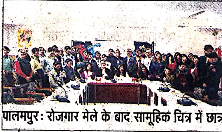
पालमपुर: रोजगार मेले के बाद सामूहिक चित्र में छात्र